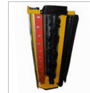
MU-Vario® pentru o formă optimizată a admisiei și carcasei și pentru o reglare progresivă a gradului de mărunțire. Prin aceasta se obțin o calitate de tocare și o defibrare ideale.