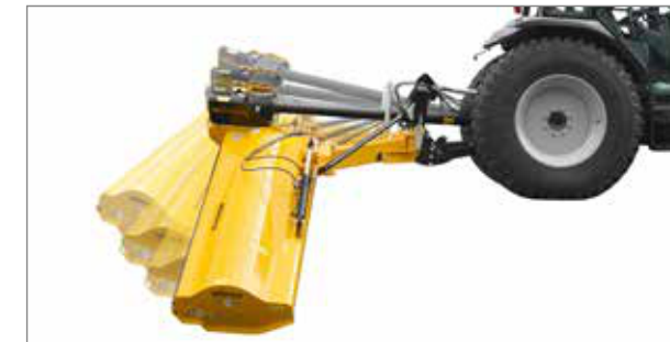
Dispozitivul mecanic de protecție împotriva coliziunii, patentat, se declanșează fiabil și revine automat în poziția de lucru.