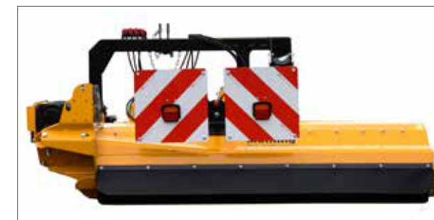
Panouri de avertizare rotative cu dispozitive de iluminare și suport fixat ferm, fără componente mobile, al sistemului de iluminare (opțional).