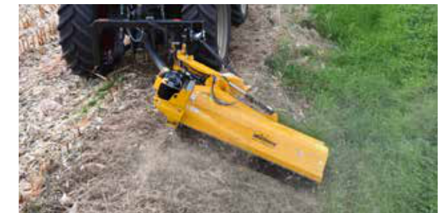
Loc suficient pentru atașarea la tractor și a arborelui articulat pivotabil.