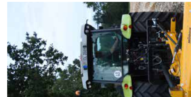
Raza de pivotare generoasă permite lucrul atât în spatele tractorului, cât și lângă acesta. La căile de circulație înguste și marginile câmpurilor resturile vegetale pot fi tocate uniform.