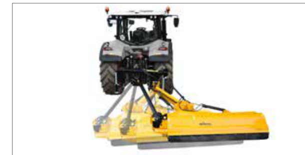
Raza de pivotare generoasă permite lucrul atât în spatele tractorului, cât și lângă acesta. La căile de circulație înguste și marginile câmpurilor resturile vegetale pot fi tocate uniform.