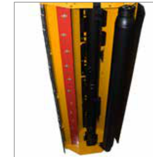
MU-Vario® pentru o formă optimizată a admisiei și carcasi și pentru o reglare progresivă a gradului de mărunțire. Prin aceasta se obțin o calitate de tocare și o defibrare ideale.