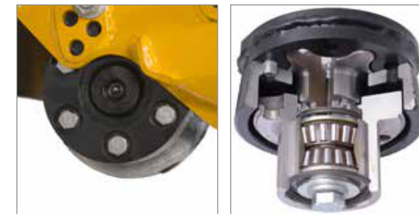
Rezemare pe valțuri de rezem Starinth®.