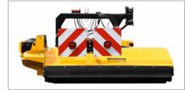
Panouri de avertizare rotative cu dispozitive de iluminare și suport fixat ferm, fără componente mobile, al sistemului de iluminare (opțional).