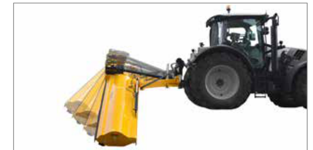
Dispozitivul mecanic de protecție împotriva coliziunii, patentat, se declanșează fiabil și revine automat în poziția de lucru.